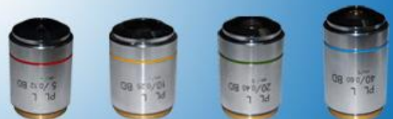
暗视场观察专用物镜